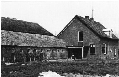
Het Huis te Vierakker thans (achterzijde). Links het oude bouwhuis.

beginnen. Voor het herenhuis zal hij weinig belangstelling gehad hebben, want in 1870, op 18 november, laat hij publiek op het Huis te Vierakker 'doen inzetten en één uur daarna voor afbraak verkoopen, genoemd Heerenhuis , voorzien van gooten en killen met lood gedekt, bestaande uit drie verdiepingen en kamers met marmere n schoorsteen-mantels'. De koper van de afbraak had de verplichting om de afbraak vóór 1 april 1871 weggeruimd te hebben.